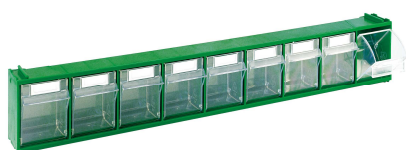
MAD1 (~ 540 g)

Note: Componibili e disponibili con fermo antiribaltamento per cassetto. Cartellini in dotazione. Solo per export disponibile colore NO (nocciola).