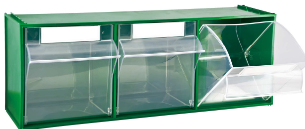
MAD5 (~ 3000 g)