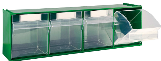
MAD4 (~ 2500 g)