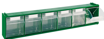
MAD2 (~ 900 g)